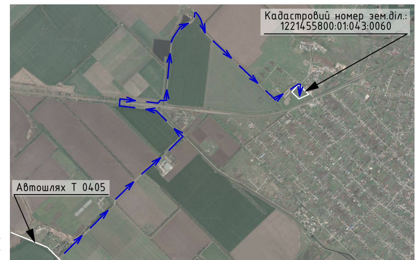
СХЕМА ПІД'ЇЗДУ ВАНТАЖНОГО ТРАНСПОРТУ ДО ЗЕМЕЛЬНОЇ ДІЛЯНКИ